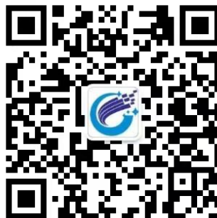
中科智库院士专家服务中心微信公众号

中国民营科技促进会 & 首席数据官工委 中国民营科技促进会 & 首席数据官工委 中国民营科技促进会 & 首席数据官工委 中国民营科技促进会 & 首席数据官工委