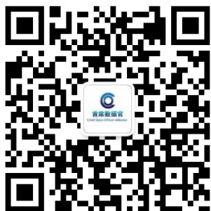
首席数据官工委微信号公众号