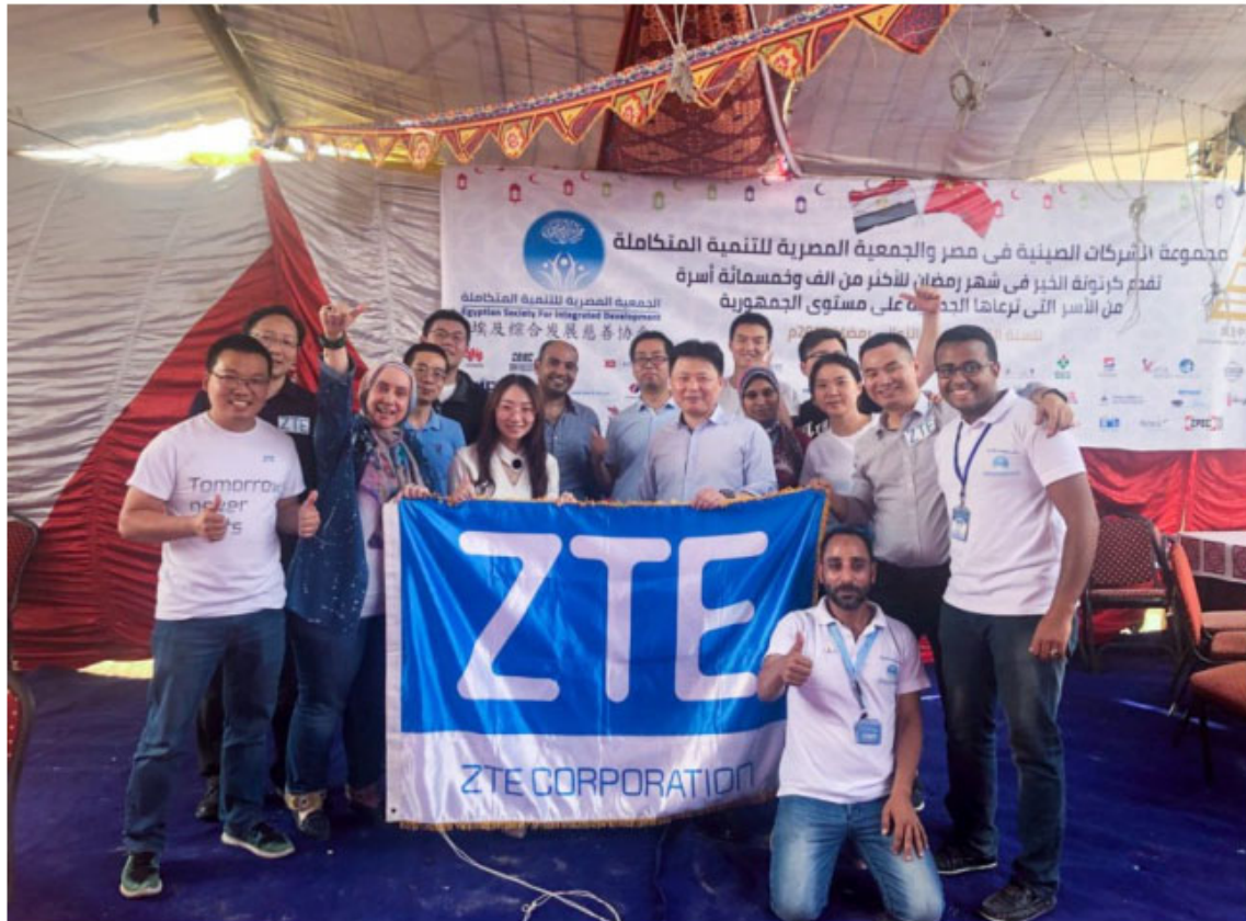
图 6 埃及国家村通计划

中国企业关注“一带一路”沿线国家的乡村数字鸿沟，积极参与数字乡村项目建设，以数字建设能力为基础，以共建国家共同发展为目标，推动数字普惠提升社会福祉。