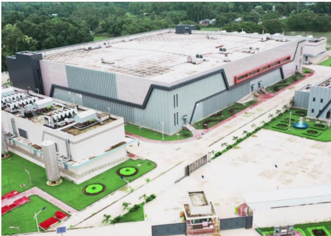
图 5 孟加拉国家数据中心建设项目

务和行业大数据的应用，也为孟加拉提供了一个先进的人才培养基地，有效提升了孟加拉人民群众的数字化生活水平，也带动了相关高科技园区的发展，极大推进了孟加拉国家数字化进程，成为实现“数字孟加拉”愿景的重要里程碑。