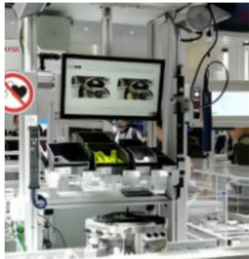
图 1 某能源企业机器视觉质检演示

需的时间周期和预算。中移国际针对上述痛点，围绕客户机器视觉质检、AGV、AR 培训、无线数据采集、无纸化办公等大带宽低时延应用，整合自有能力和供应商生态，为客户提供了一站式的解决方案，包括：5G 运维平台、跨境回国专线、5G 核心网、5G 无线网（专网）、承载网以及相应的集成服务、设备安装及布线，从而帮助客户提升生产办公场景的工作效率与安全等级，并实现无纸化办公场景和机器视觉质检等应用能力。