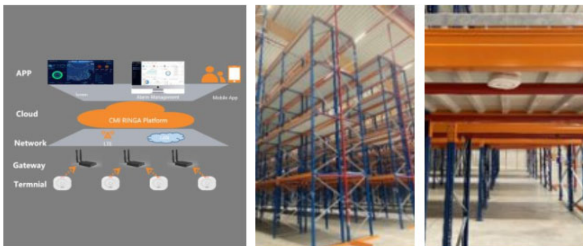
图 2 某新能源企业物联网智能烟感项目方案演示

某电池研发制造公司，在全球扩建中遇到安全生产方面的挑战。中移国际从消防火灾监测着手，为企业研发智能烟感系统，基于 IoT 技术，实现对厂房和仓库的气体实时监测，并采用国际先进的 Thread 烟感方案，成功为企业部署高密度、高并发、近距离的低功耗智能烟感系统。目前已为企业落地部署超过 11000 个烟感，且满足欧盟发布的“通用数据保护条例”（GDPR）相关数据管理规则，并通过当地政府的联合安防验收。