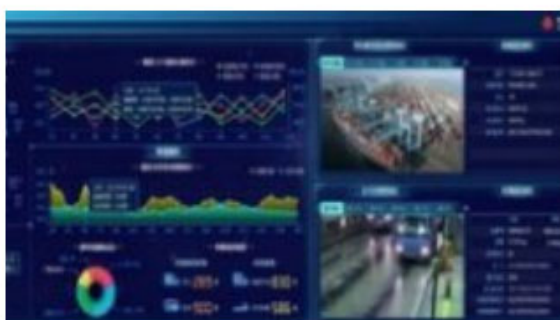
5G 港口 AOC