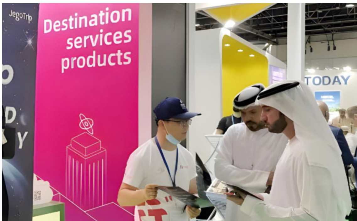
图 4 无忧行参与“阿拉伯国际旅游展”现场

除了通过资费的合理化设计和体验上的便利性设计以外，还特别针对漫游用户场景设计人身安全、财产安全和服务安全方面的系列功能，将惠民做到实处。第二，全球数据卡业务面向全球商旅客户推出的全球流量上网产品，支持 SIM、软 SIM、eSIM 等多种产品形态，在全球超过 180 个国家和地区提供上网服务，已累计提供超过 1400 万人天。第三，无忧行面向广大出境游用户，打造吃、住、行、玩、购等一站式跨境出行生活服务平台，满足用户全链路需求，目前服务超过 7100 万全球用户。2022 年 5 月，无忧行参与 2022 年第 29 届“阿拉伯国际旅游展”，中国移动中东非团队积极接触来自世界各地的旅游文化招商局、酒店集团和旅游中介公司，并积极设计创新产品和服务，应对疫情后发生巨大变化的旅游市场，切实推动多地的旅游业和消费业的复苏。